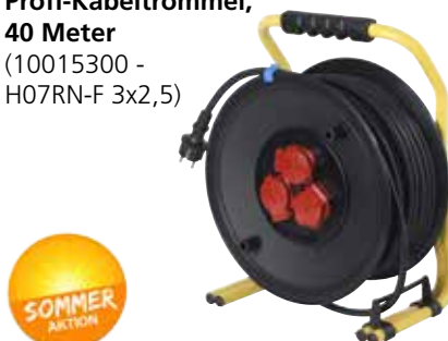
Profi-Kabeltrommel, 40 Meter (10015300 - H07RN-F 3x2,5)

1 Stck. 3x2,5 Listenpreis 183,00€ Sonderpreis 99,00€