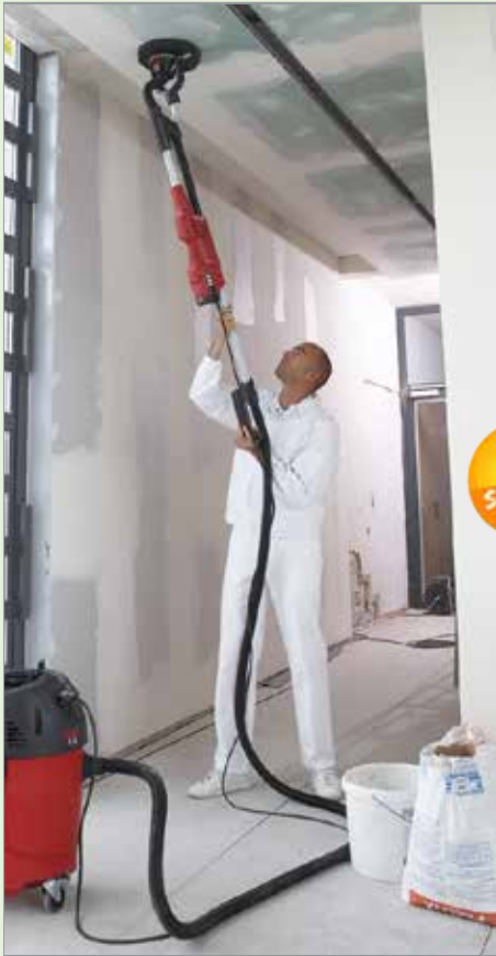
Wand- und Deckenschleifer Giraffe GE 5 R „Sparpaket“ (422827)

Innerhalb von Deutschland: Versandkostenfrei! Gültig bis 31.10.2017