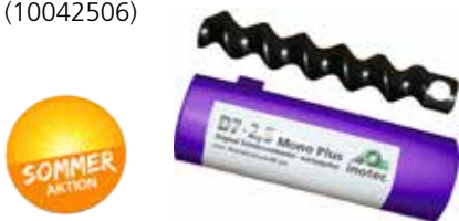
Rotor D7-2,5 „S“ (10022556) Stator D7-2,5 „Monoplus“ (10042506)

Listenpreis Sonderpreis 1 Paar 98,85€ 78,00€ 6 Paare 593,10€ 455,00€ 12 Paare 1.186,20€ 880,00€