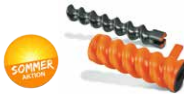
Rotor D6-3 Helix (10036994) Stator D6-3 Helix (10036995)

Listenpreis Sonderpreis 1 Paar 107,90€ 75,00€ 6 Paare 647,40€ 428,00€ 12 Paare 1.294,80€ 820,00€