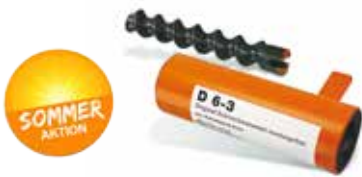
Rotor D6-3 (10022555) Werkstoff C45 Stator D6-3 (10022511) orange, wartungsfrei, zylindrisch

Listenpreis Sonderpreis 1 Paar 75,10€ 55,00€ 6 Paare 450,60€ 309,00€ 12 Paare 901,20€ 595,00€