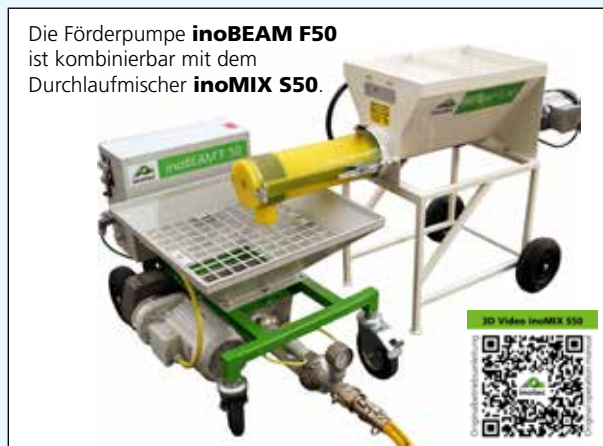
Die Förderpumpe inoBEAM F50 ist kombinierbar mit dem Durchlaufmischer inoMIX S50 .