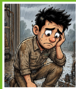
Maschine irgendwo gekauft