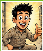
Maschine bei INOTEC gekauft

Einweisung, Service und Baustelleneinsätze - DIREKT vom Hersteller & DIREKT vor Ort